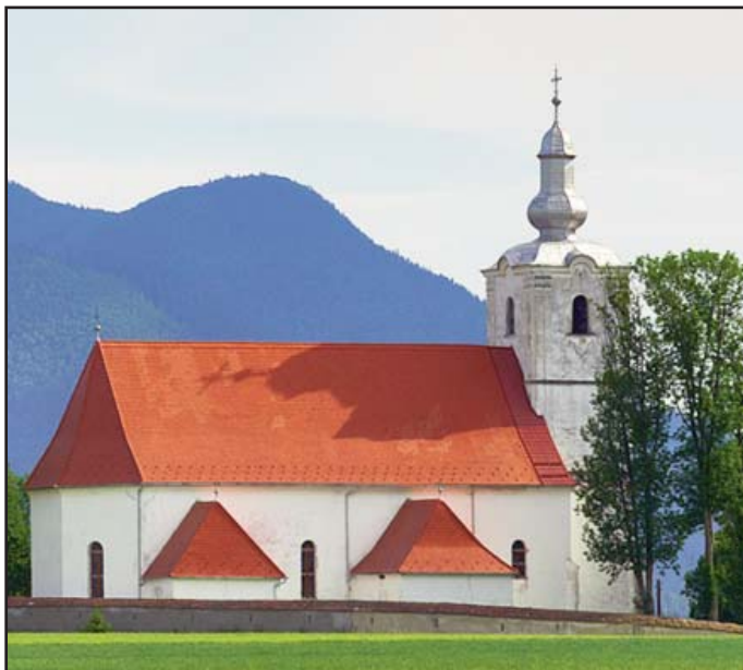
A tusnádi Asszisi Szent Ferenc plébániatemplom

További információk a https://www.facebook.com/profile.php?id=100064378104297 facebook oldalon.