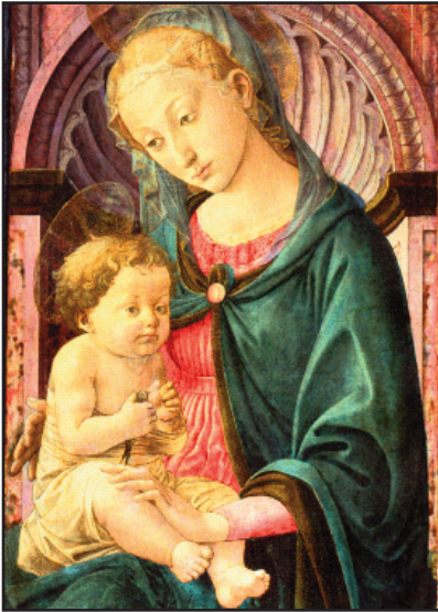
Francesco di Stefano Pesselino: Mária gyermekével

A Máriáról szóló katolikus hitigazságok közül az ő mennybevételéről szólót ünnepeljük a mai napon, amely ünnepet a magyar hagyomány szerint Nagyboldogasszonynak nevezünk. Még a vallásukat gyakorlóknál is előfordul, hogy mennybevétel helyett mennybemenetelt emlegetnek Mária esetében. Ez a megfogalmazás pontatlan. Jézus Krisztus esetében mennybemenetelt mondunk, ezt