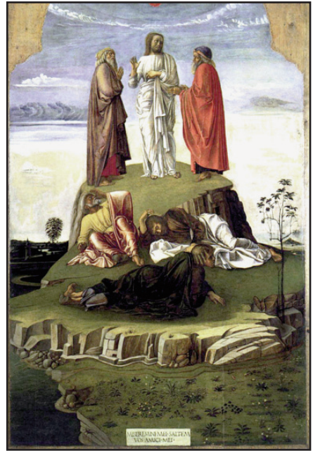
Bellini: Urunk színeváltozása

A nyugati egyházban az első ezredforduló közeledtével kezdték számon tartani,