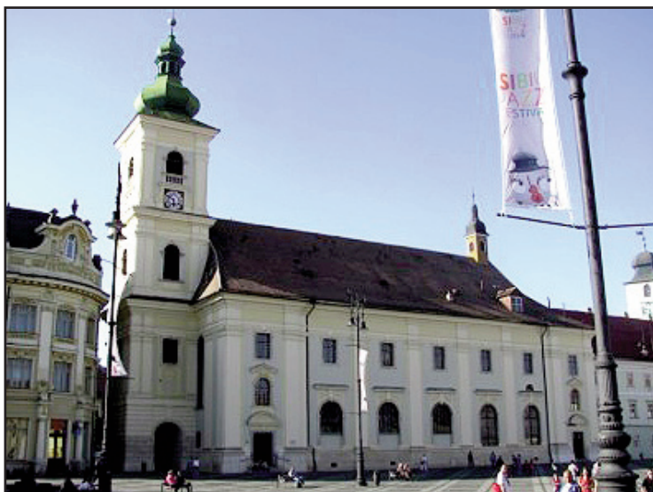
A szebeni Szentháromság plébániatemplom