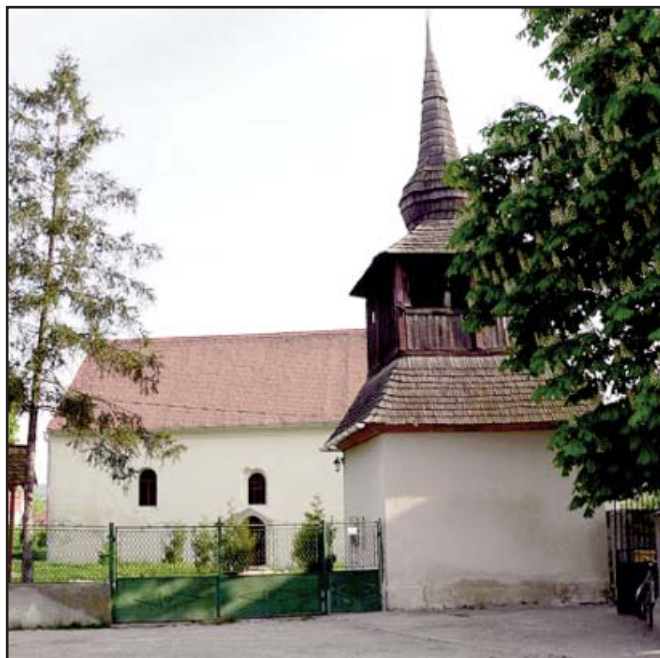
A Szent Kereszt felmagasztalása plébánia-templom