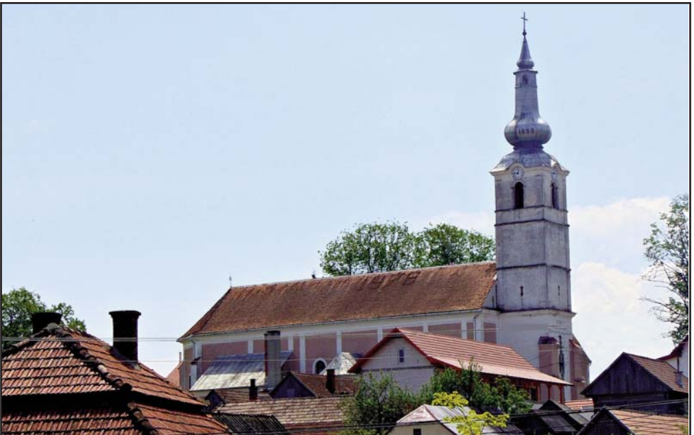
A gyergyóremetei Szent Lénárd apát plébániatemplom