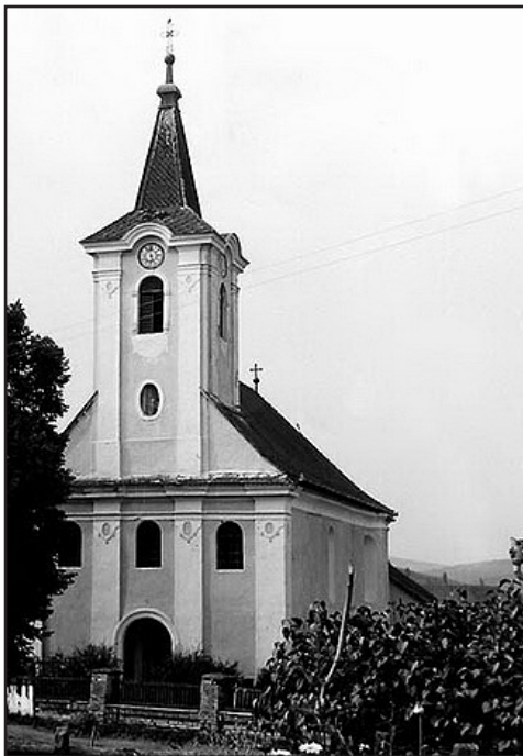
A székelykáliai Sarlós Boldogasszony templom

Székelykál, de még inkább a filiák ki vannak téve az elöregedés veszélyének. A gyermek kevés, a hívek többsége idős, de azért a lelkipásztori gondozást, aki bennük és közöttük az Isten országát építi, igénylik és elvárják.