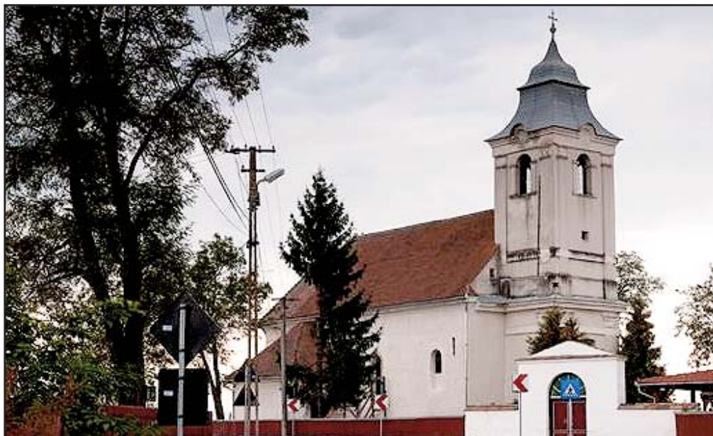
Az imecsfalvi Kisboldogasszony plébániatemplom

Léstyán Ferenc: Megszentelt kövek, ersekseg.ro