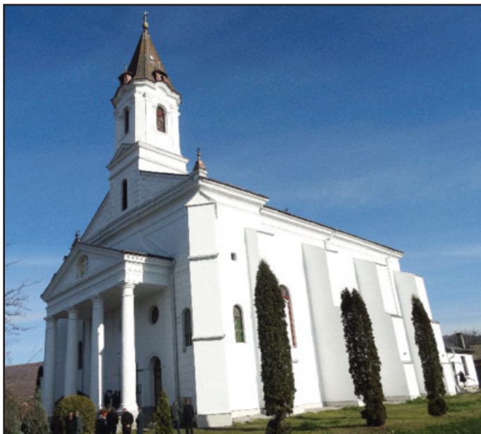
A gelencei, 1903-ban felszentelt plébániatemplom

fontos szerepet töltöttek be a háromszéki esperességben: 1628-1648-ig folyamatosan gelencei plébánosok voltak az esperesek, ami a 17-18. század folyamán többször megismétlődött. A 17. század első felében jelentős szerepet játszott az egyházközség életében és a felszegei templom kazettáihoz nyújtott támogatásban Tholdalagi Mihály, aki Bethlen Gábor és I. Rákóczi György legtekintélyesebb diplomatája, Háromszék, majd Udvarhelyszék főkapitánya és a mikházi ferences kolostor alapítója volt. Felesége, Mihálcz Erzsébet, a gelencei nemes, Mihálcz Miklós leánya volt. Az egyházközség lakosságát több pestisjárvány tizedelte, legsúlyosabb közülük az 1747-es volt. Ennek emléket őrizi a műemléktemplom déli bejárata előtt elhelyezett faragott kőoszlop, az ún. „pestis-kereszt”. A gelencei egyházközségnek két temploma van: a 13. század közepén épült Szent Imrének szentelt műemlék temp-