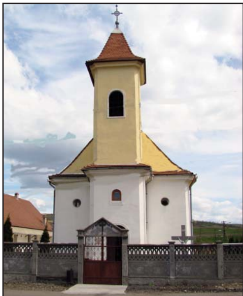
Urunk mennybemenetele plébániatemplom