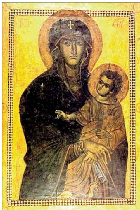
A Szent Lukácsnak tulajdonított Mária-ikon, a Salus Populi Romani (Santa Maria Maggiore-bazilika, Róma)

A Kolosszeieknek írt levél záradékából tudjuk Lukács eredeti foglalkozását, mert Szent Pál ezt írja: „Köszönt benneteket Lukács, a kedves orvos” (Kol 5,15). Minden jel arra mutat, hogy a pogány ifjú, Lukács Barnabás és Pál tanítványaként ismerkedett meg az evangéliummal, majd a foglalkozásából, orvos mivoltából adódó pontosság- és hitelességigénytől hajtva, a Szentlélektől vezérelve útra kelt, hogy utánajárjon mindannak, amit Krisztusról hallott. Találkozhatott még a Szűzanyával, továbbá az egykori tanítványokkal, gyógyult betegekkel, vakokkal, talán Lázárral is. Nagyon sok olyan eseményt és részletet is leír, melyek más evangéliumokban nem találhatóak (Angyali üdvözet, Mária Erzsébetnél, a gyermek Jézus, az irgalmas szamaritánus, a gazdag ember és Lázár, a farizeus és a vámos imája, a vérrel verítkezés, a tékozló fiú stb.). Ezek az értékes részek megmutatják Szent Lukács csodálatos lelki tulajdonságait.