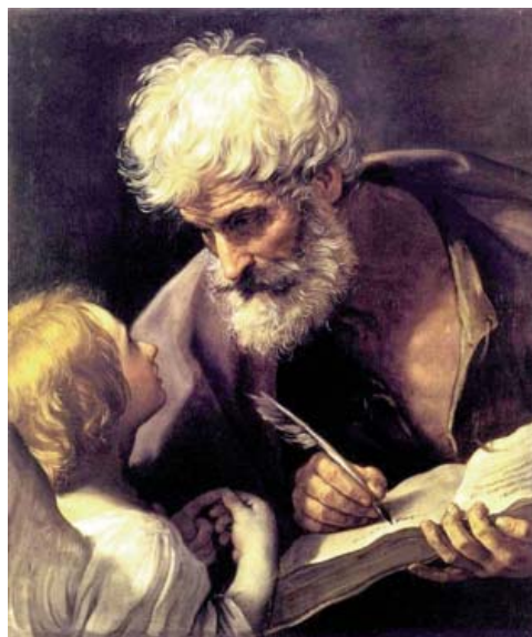
Guido Reni: Szent Máté (1635-40)

Evangéliuma szerint Máté vámos volt és a Lévi nevet is viselte. Márk még azt is tudja