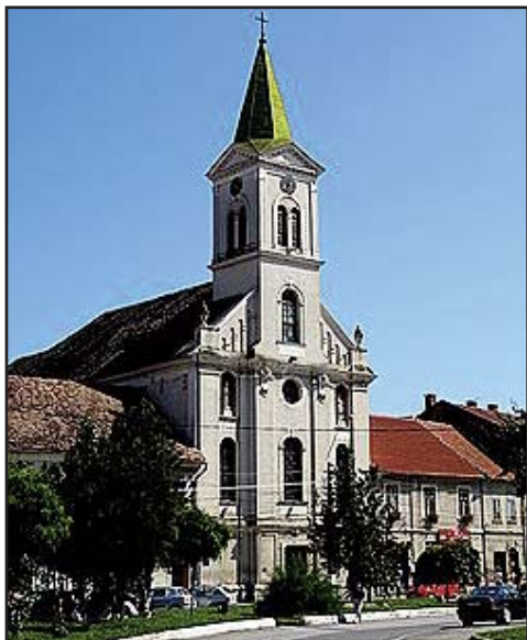
Árpád-házi Szent Erzsébet plébániatemplom